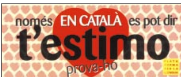
Adhesiu imprès el 1997, relacionat llengua i sentiments, editat en diverses variants dialectals: t'estimo, t'estimi, t'estime i t'estim