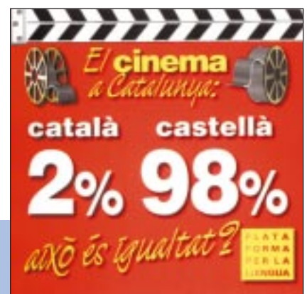
Adhesiu editat el 1998, durant la redacció de la Llei de Política Lingüística del 98 al Principat