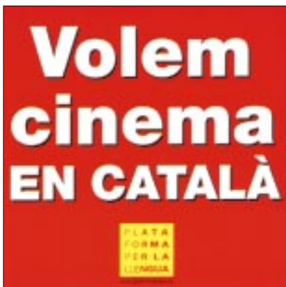
Imprès el 1998, en plena polèmica pel "decret de cinema" desenvolupat per la Generalitat de Catalunya