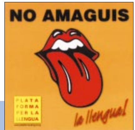
Adhesiu editat el 1997 promocionant l'ús del català