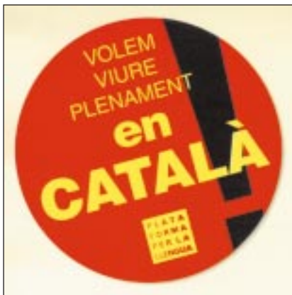
Adhesiu pioner i fruit de la primera campanya corporativa de l'organització. Editat el 1996.

lemes dels quals han girat a l'entorn de la denúncia i l'exigència de la presència del català. Hem fet al voltant d'un centenar de dissenys de diversos tipus i característiques i n'hem repartit milers amb la intenció de conscienciar i mobilitzar la societat civil. Tot seguit teniu una mostra representativa dels que han tingut més èxit.