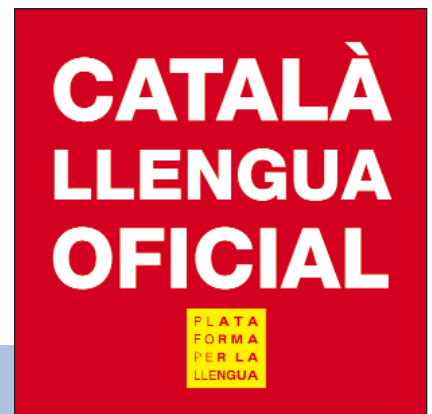
Imprès el 1999, tot exigint l'oficialitat del català a la Catalunya Nord.